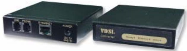
Einzelmodem VDTU101/201 (CO oder CPE sehen gleich aus)

VDSL steht für „very high speed digital subscriber line“ und überträgt Daten über ein Adernpaar bis zu 1,9 km. Dabei werden Übertragungsraten bis 25 Mbit/s full duplex erreicht (50 Mbit/s in Summe up/down). Die Familie von VDSL Modems besteht aus den Einzelgeräten VDTU201 (CPE) und VDTU101 (CO), jeweils für die Kundenseite (CPE: Customer Premises Equipment) oder für die Zentrale (CO: Central Office). Für größere Installationen bietet sich in der Zentrale ein 8-fach Konzentrator oder ein 24-fach Konzentrator an, der jeweils 8 oder 24 CO Modems in einem 19“-Einschub von nur einer Höheneinheit unterbringt.